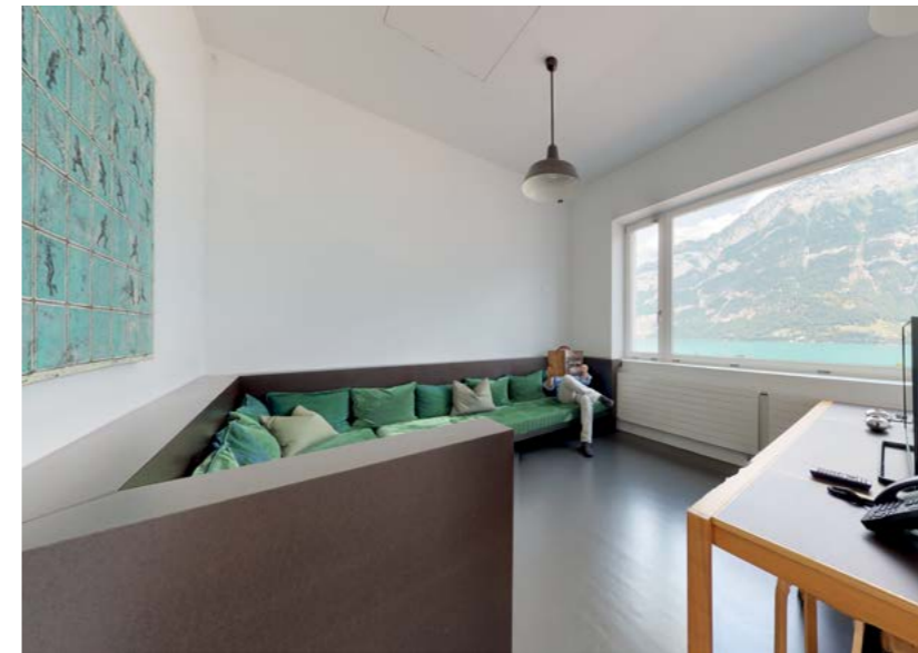
Chillbereich mit Panoramafenster Turmloft. Detail Schlafzimmer Turmloft. Panoramablick. Grundriss Loftsuite.