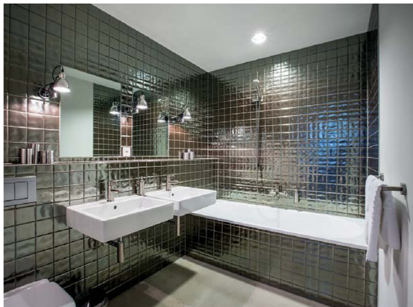
Blick Schlafzimmer Loftsuite. Detail Küche Turmloft. Badezimmer Loftsuite. Innenansicht Ess- und Wohnbereich Loftsuite.

INFORMATIONEN. ARCHITEKTUR-BÜRO> RLC ARCHITEKTEN, HERMANN UND KATHARINA STUCKI SCHMEZER // 2013. ALTE FABRIK> LOFTSUITE 330 QM UND TURMLOFT 90 QM // 4 UND 8 GÄSTE // 2 UND 4 SCHLAFZIMMER // 1 UND 2 BADEZIMMER. ADRESSE> ALTE SPINNEREI, MURG AM WALENSEE, SCHWEIZ. WWW.LOFTHOTEL.CH/UEBERNACHTEN/FERIENWOHNUNGEN/