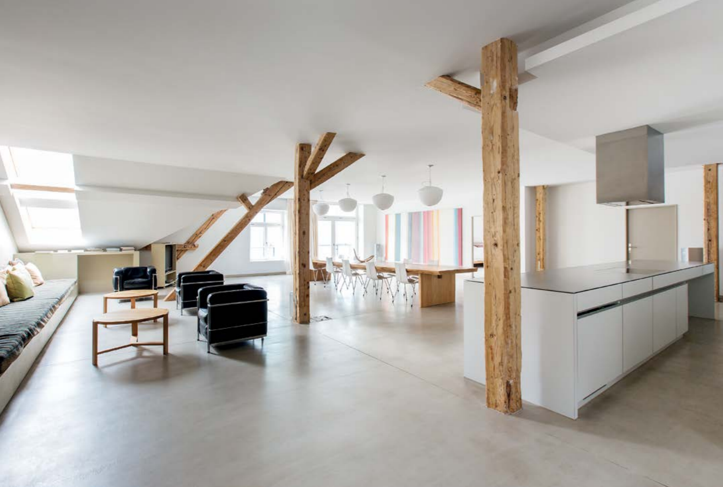
Innenansicht des offenen Wohnbereichs Loftsuite. Schlafzimmer Turmloft.